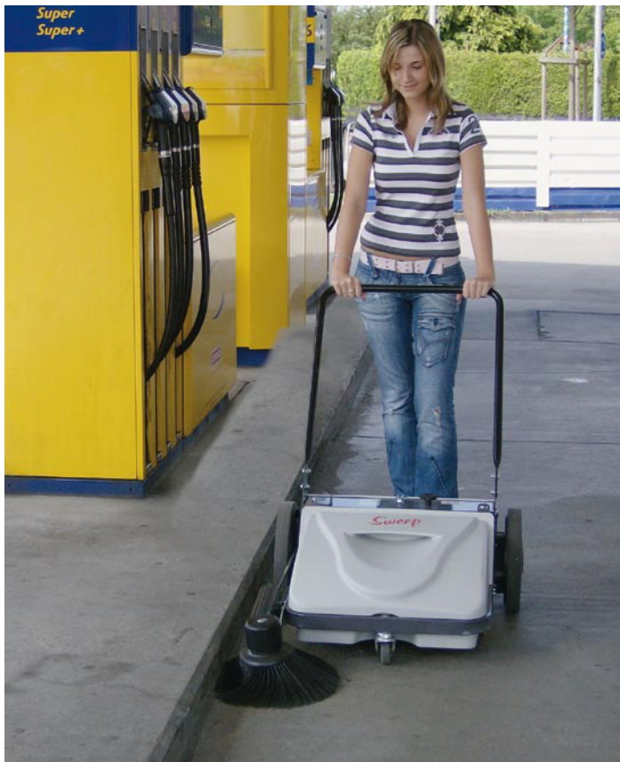
Sweep 5 Plus – mechanisch und doch mit Absaugung.