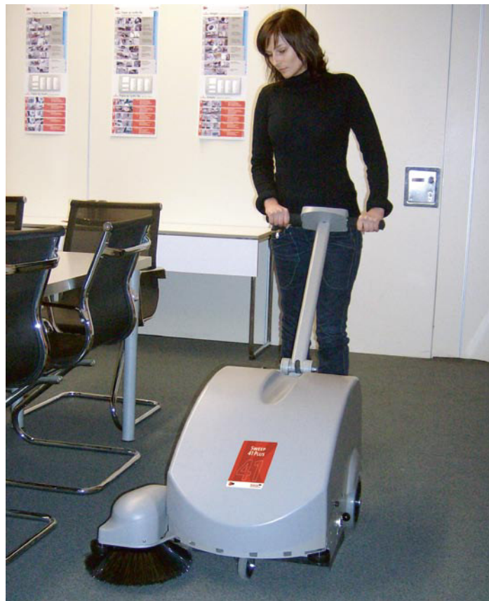
Sweep 41 Plus – auch zum Teppichkehren.