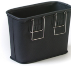
Rekola EVA Zubehörbox

Produkt-Code: 47267 Farbe: Grau Abmessung: 15 x ø 8,5 cm