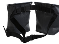
Rekola Gürtelschnalle (ohne Beutel)

Produkt-Code: 47263 Farbe: Grau Abmessung: 10 x 6,5 x 17 cm