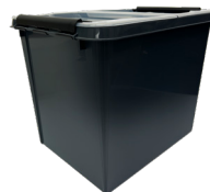
Rekola 25l Box inkl. Deckel