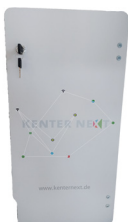
Tür individuell bedruckt

Die Türen können auf Anfrage individuell bedruckt werden. Sprechen Sie mit Ihrem zuständigen Ansprechpartner.