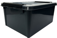
Rekola 15l Box inkl. Deckel

Produkt-Code: 47261 Farbe: Grau Abmessung: 170 x 260 x 450/500 cm